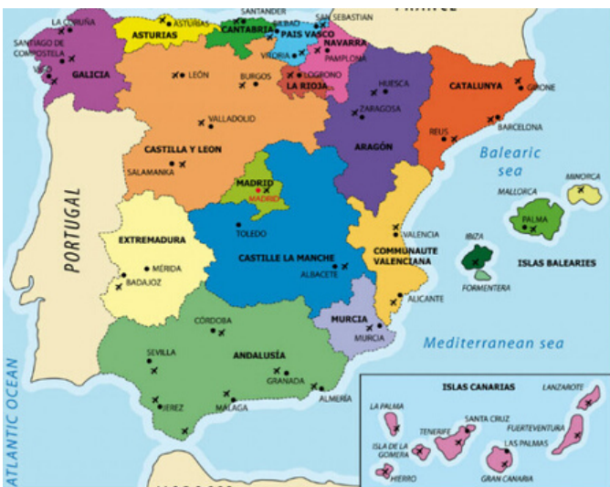
Map of Spain's regions.