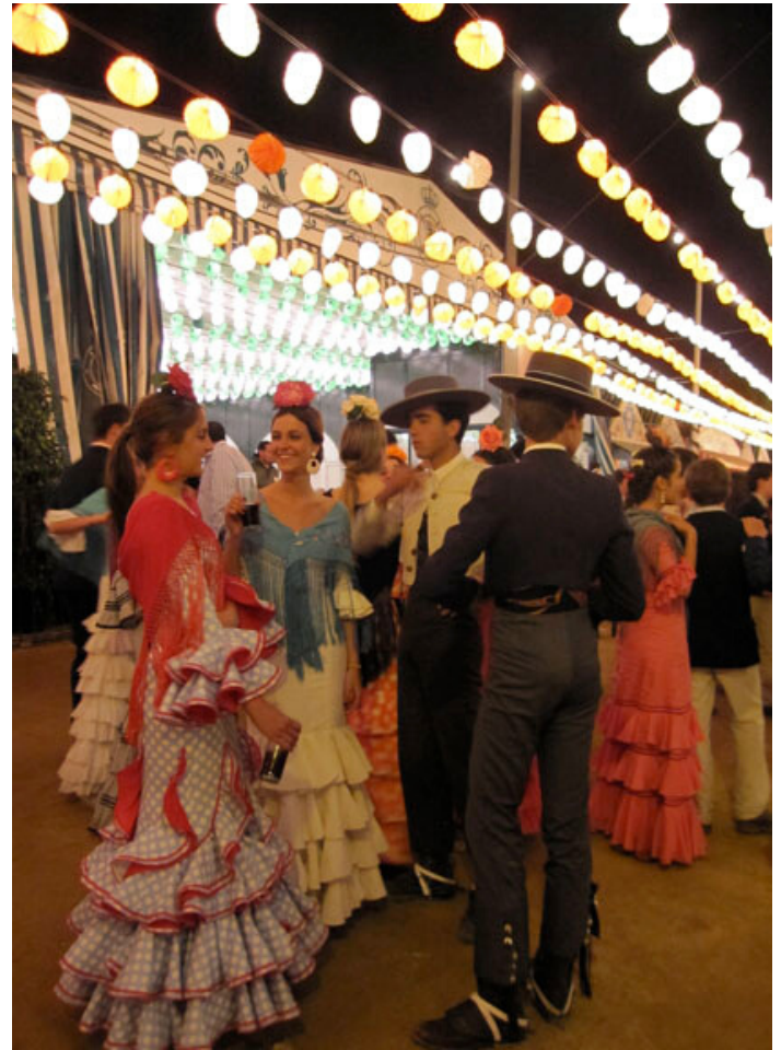
Fairgoers in Seville, Spain, 2012.

Dentro del discurso histórico sobre el flamenco hay un considerable debate sobre la mezcla que tuvo lugar entre las danzas regionales, las diversas culturas de España, y las tradiciones de puro origen gitano. La primera difusión de un estilo musical particular a Andalucía tuvo lugar a principios del siglo II d.C. cuando España formaba parte del Imperio Romano. Las influencias posteriores incluyen estilos musicales árabes, cristianos y sefardíes. Los gitanos llegaron durante la época medieval trayendo consigo las culturas de la India, Europa del Este y el Imperio bizantino, junto con su propio patrimonio. Todas estas tradiciones se mezclaron con la música del sur de España y se convirtieron en parte de la familia del canto y la danza flamenca.