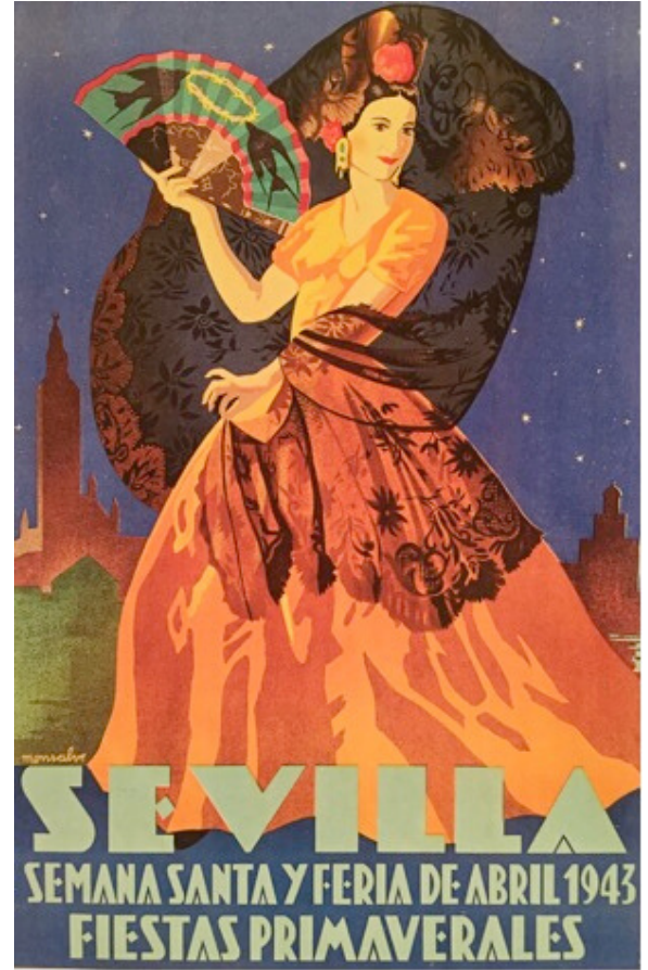
Posters for spring festivities in Seville, Spain, 1904 and 1943. Posters such as these advertised Semana Santa (Holy Week), the April Fair, and the opening of the spring bull fighting season.

En Nuevo México, el flamenco ha encontrado un hogar lejos de casa. Ahora varias generaciones de bailarines y músicos entregan la tradición a estudiantes y miembros más jóvenes de la familia. Las juergas privadas y las fiestas flamencas existen junto a actuaciones profesionales en pequeñas discoteca y grandes teatros. El duende , o el espíritu del flamenco, está grabado para siempre en las mentes y corazones de los nuevomexicanos.